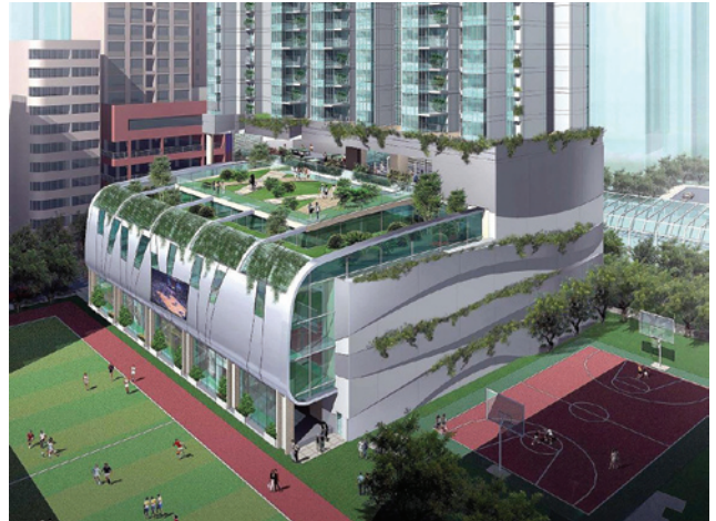
麥花臣室內場館項目提供現代化場館設施及青年中心。

二零零六年四月，本局與香港遊樂場協會公布，合作重建發展設施落伍的麥花臣室內場館，提供一個現代化的室內場館、一個青年中心，以及住宅和零售樓面。經過與屋宇署及地政總署的詳細商討後，經修訂的建築圖則於二零零八年三月得到批准，而補地價建議亦於同年五月獲得同意。本局與香港遊樂場協會也於五月為發展這個項目而進行公開招標，並於六月批出有關合約。由於此項目鄰近洗衣街重建計劃，本局有意將兩個項目連結起來，在兩個項目之間的街道，進行美化工程。此外，這個項目亦可以在洗衣街的重建期間，為受該項目影響的部份體育用品商舖經營者，提供暫時性的舖位，令他們可以在該區繼續經營。