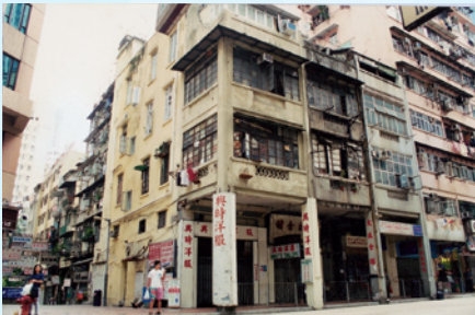
三幢廣州式「騎樓」建築 將會活化再用。

此項目的總綱發展藍圖於二零零七年五月獲得城規會批准。同年十二月，本局公布設立以婚嫁為設計主題的「姻園」，設立香港首個婚嫁傳統文物館，並將提供零售用地，給予一系列與婚嫁有關的商品和服務，例如婚紗禮服、鮮花、場地布置、禮餅、髮型屋、珠寶首飾、影樓、及婚宴統籌服務等。此外，本局亦會在項目內推行社會企業試驗計劃，邀請熟悉地區的機構，經營社會企業，以保存和強化區內的社區網絡。項目的清拆工程已在年內完成。另外，利東街道路封閉及其他道路事宜已於二零零八年四月刊憲。本局亦會在合適時間邀請發展商提交合作發展意向書。