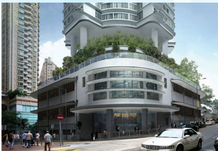
灣仔街市大樓的主體部分將會原址保存。