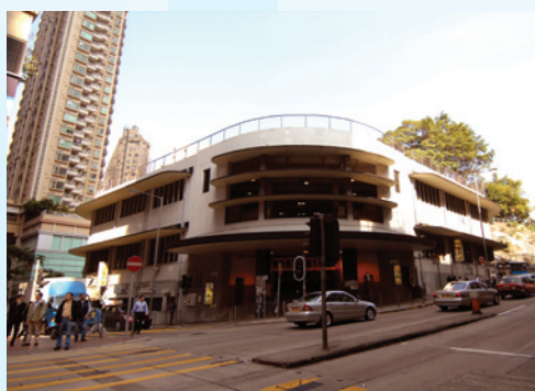
灣仔街市大樓的現貌。

經修訂的總綱發展藍圖，灣仔街市大樓的主體，包括外殼、外牆、主要入口、弧形簷篷和鰭形設計，以及前面部分的結構形態將會原址保留。這是一個務實的方案，本局既可履行與發展商的合約，亦在實際可行的情況下，回應社區對保育街市大樓的訴求。預計本局會增加超過二億元的額外成本，以及涉及較長的發展期。