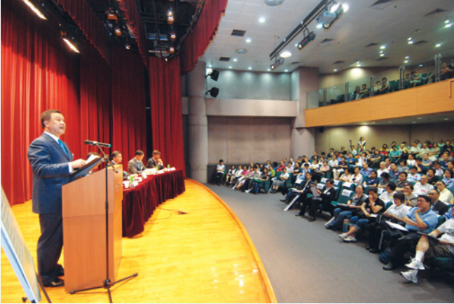
市建局主席張震遠先生與觀塘市中心的居民溝通，了解他們的訴求。