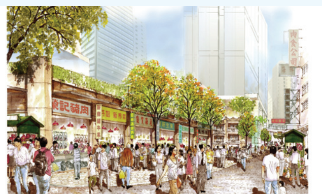
從嘉咸街(上)及結志街(下)望向的兩層高建築，用作容納項目內的濕貨店舖。