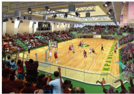
重建計劃將興建一所新穎室內場館。