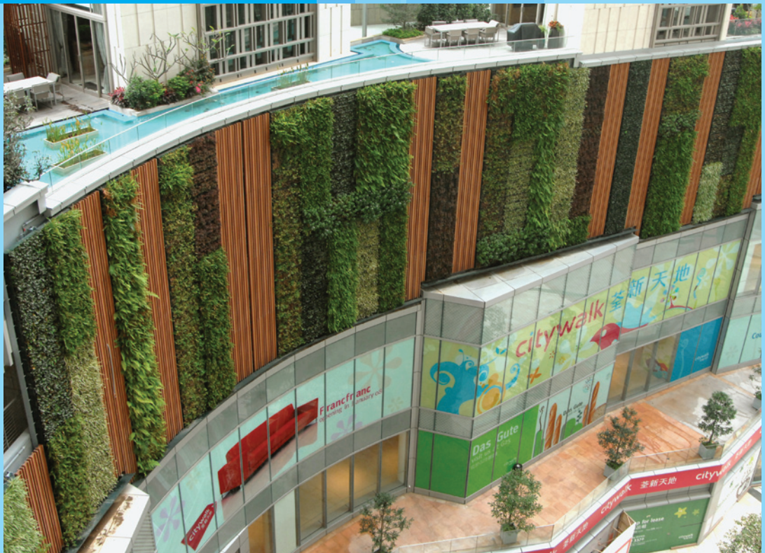
荃灣市中心項目提供約八千平方呎的垂直綠化帶。