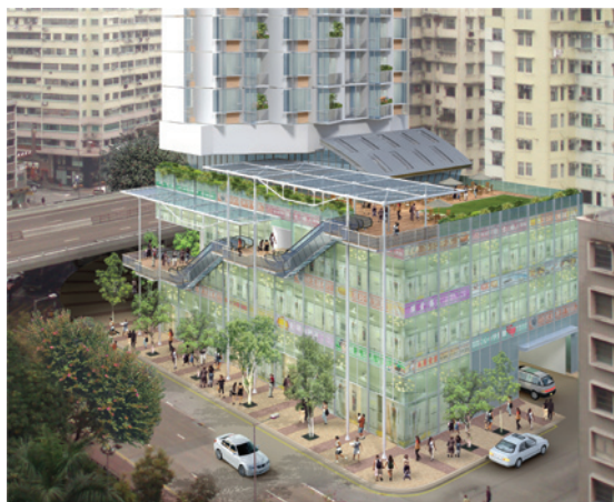
浙江街／下鄉道項目採用建築物後移設計，以騰出更多地面空間疏通人流。

浙江街／下鄉道項目為本局根據《市區重建局條例》於二零零八年二月二十九日在馬頭角開展的兩個新項目之一。佔地約九百三十平方米，這個小型項目內的樓宇均建於一九五零年代，樓宇狀況非常殘舊。本局藉着推行這個項目的同時，會在毗鄰東九龍走廊橋底的地方，進行街道改善工程。由於在兩個月的公眾諮詢期內沒有收到任何書面反對，發展局局長授權本局進行該項目的決定已於二零零八年七月十八日刊憲。